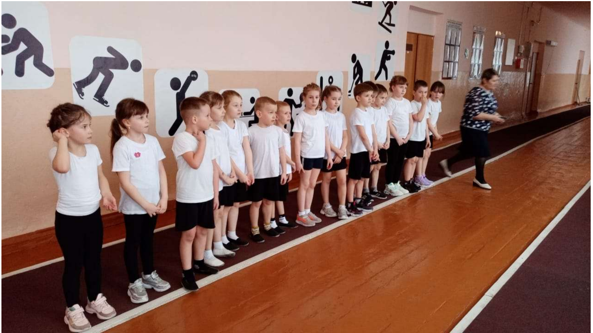
В начале соревнований инструктор по физической культуре провела разминку для детей.